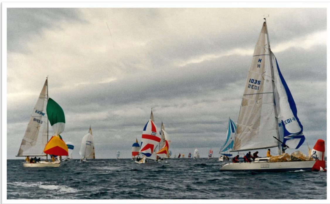
Trofeo Príncipe de Asturias 1986

Junto a las tradicionales pruebas deportivas, en las que todos tienen cabida (veleros de regata, cruceros, monotipos, clásicos...), el Trofeo Príncipe de Asturias incluye también desayunos, encuentros, degustaciones, entregas de premios, fuegos artificiales, fiestas... Es, en definitiva, un atractivo encuentro para que navegantes de todo el mundo puedan disfrutar juntos de la pasión que comparten: la vela.