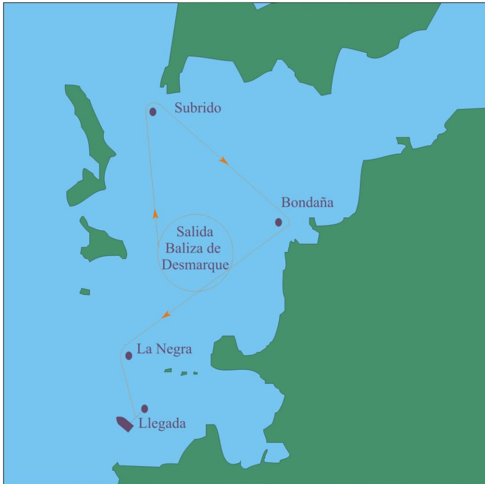
Recorrido Costero Alternativo

Zona de llegada: Inmediaciones de la baliza de Carallones