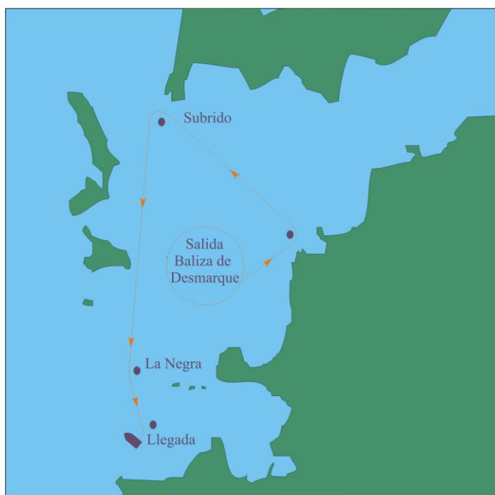
Recorrido Costero Alternativo

Zona de llegada: Inmediaciones de la baliza de Carallones.